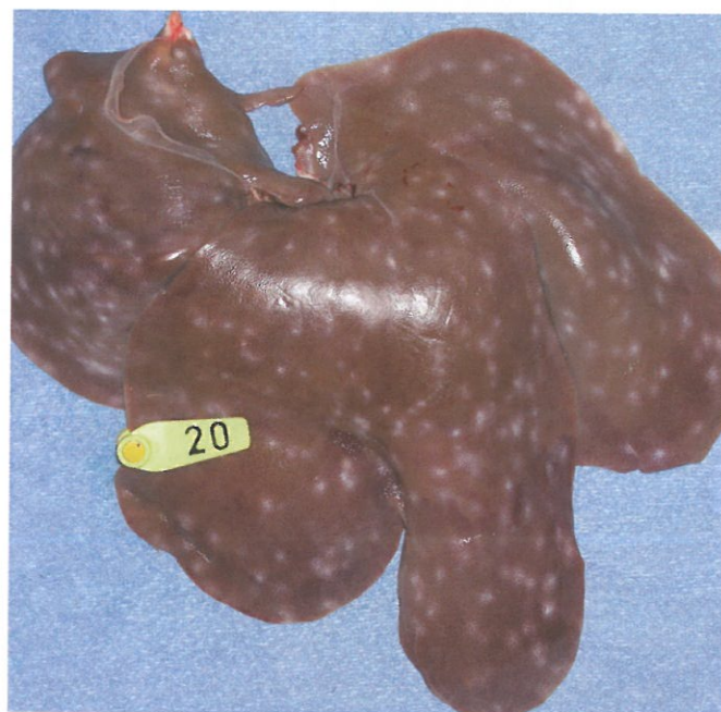
Spolormens arven vandrer igennem grisens lever og giver hvide ormepletter.

Hvis æggenes deponeres udenørs, dør langt de fleste indenfor nogen få uger. I en besætning, hvor der udskilles mange millioner af æg hver dag, er der dog stadig rigeligt tilbage til at sikre en fortsat smitte i mange år. Som nævnt i fagmagasinet SVIN tilbage i november 2011 er et projekt derfor ved at kortlægge smitteudbredelsen i fem danske økologiske svinebesætninger.